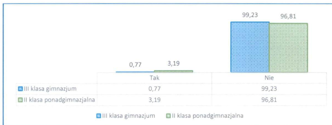
Wykres 18. Czy używałeś dopalaczy?

Gdy zapytaliśmy ankietowanych o używanie dopalaczy, 96,81% starszych ankietowanych i 99,23% młodszych odpowiedziało przecząco na to pytanie. Pozostałe 3,19% (tj. 3 osoby) z II klas szkół ponadgimnazjalnych i 0,77% uczniów, tj. 1 osoba z III klas gimnazjum przyznało, że używało dopalaczy.