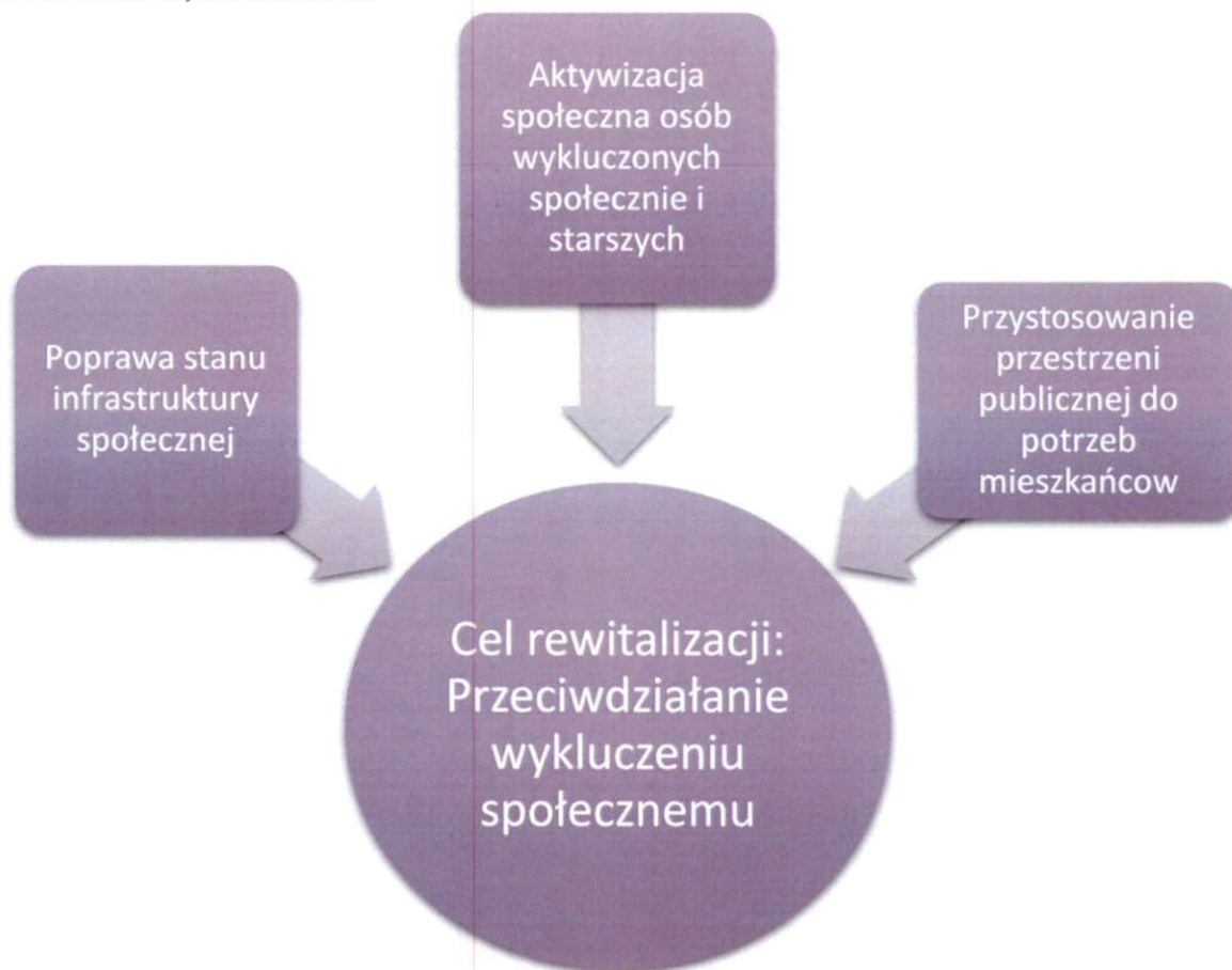
Rysunek 4 Cel rewitalizacji i kierunki działań

Przedstawione poniżej cele zostały opisane na podstawie skwantyfikowanych wskaźników z określonymi wartościami bazowymi i docelowymi. Ponadto, wybrane kierunki działań, pozwolą na osiągnięcie założonych celów rewitalizacji i pozwolą na wyjście obszaru rewitalizacji ze stanu kryzysowego.