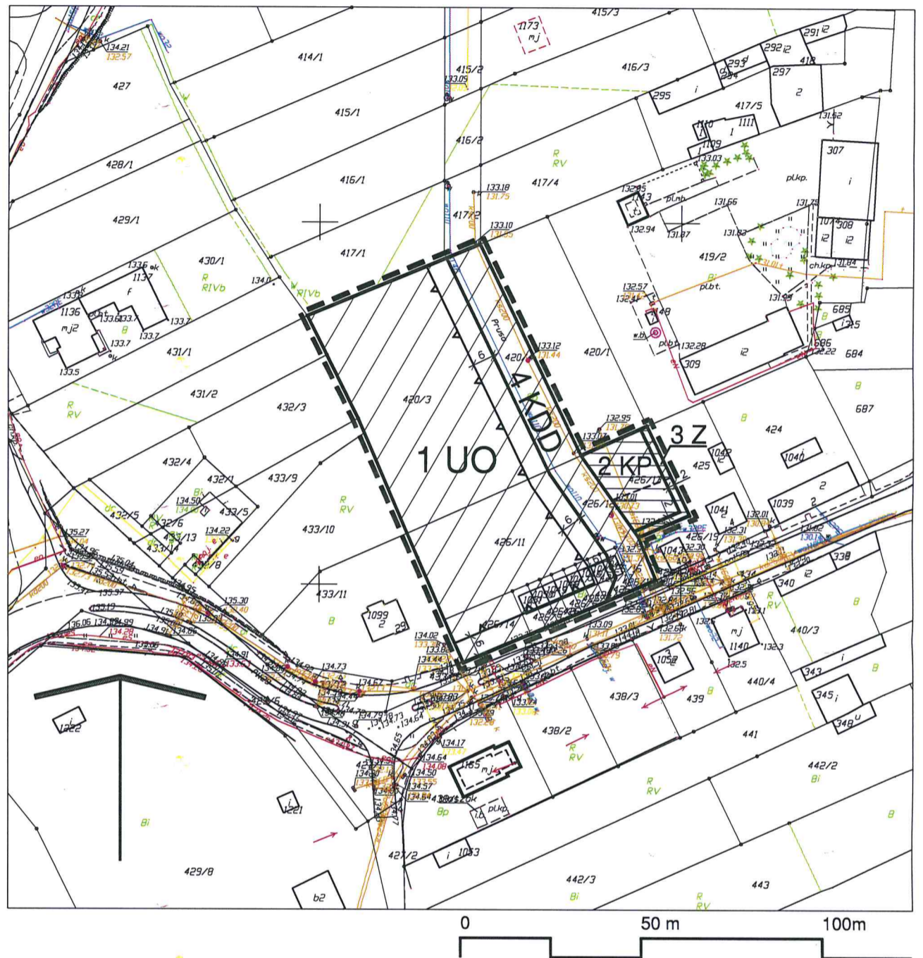
WYRYS ZE STUDIUM UWARUNKOWAŃ I KIERUNKÓW ZAGOSPODAROWANIA PRZESTRZENNEGO MIASTA I GMINY SĘPÓLNO KRAJEŃSKIE