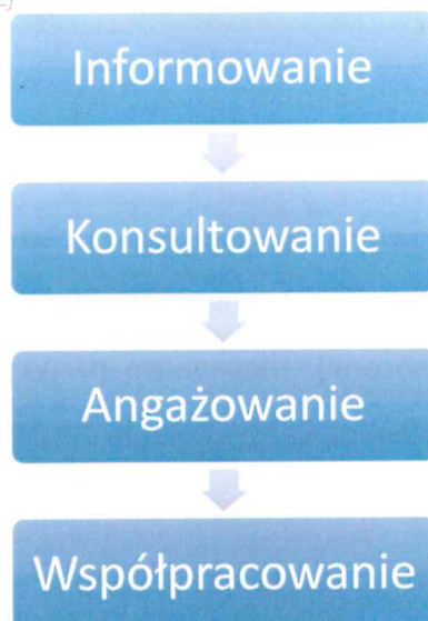
Rysunek 9 Poziomy partycypacji społecznej