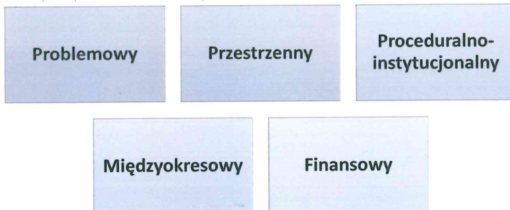
Rysunek 8 Rodzaje komplementarności rewitalizacji

Niezwykle istotnym aspektem wdrażania projektów i przedsięwzięć rewitalizacyjnych jest zapewnienie ich komplementarności w szerokim spektrum funkcjonowania. Komplementarność ma charakter: