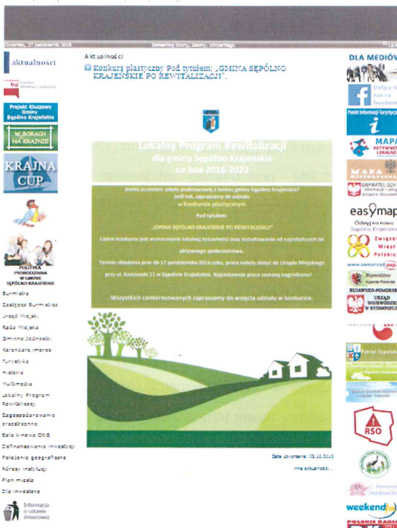
Rysunek 13 Informacja o rozpoczęciu konkursu plastycznego