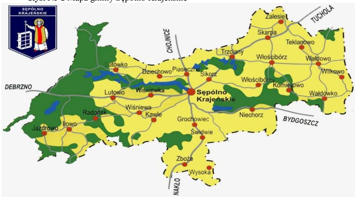
Rys. Nr 1 Mapa gminy Sępólno Krajeńskie

Powierzchnia gminy Sępólno Krajeńskie wynosi 22 912 ha co stanowi 28,96 % ogólnej powierzchni powiatu sępoleńskiego i pod tym względem lokuje ją na 2 miejscu w powiecie. W rozbięciu na poszczególne gminy powierzchnia kształtuje się następująco: