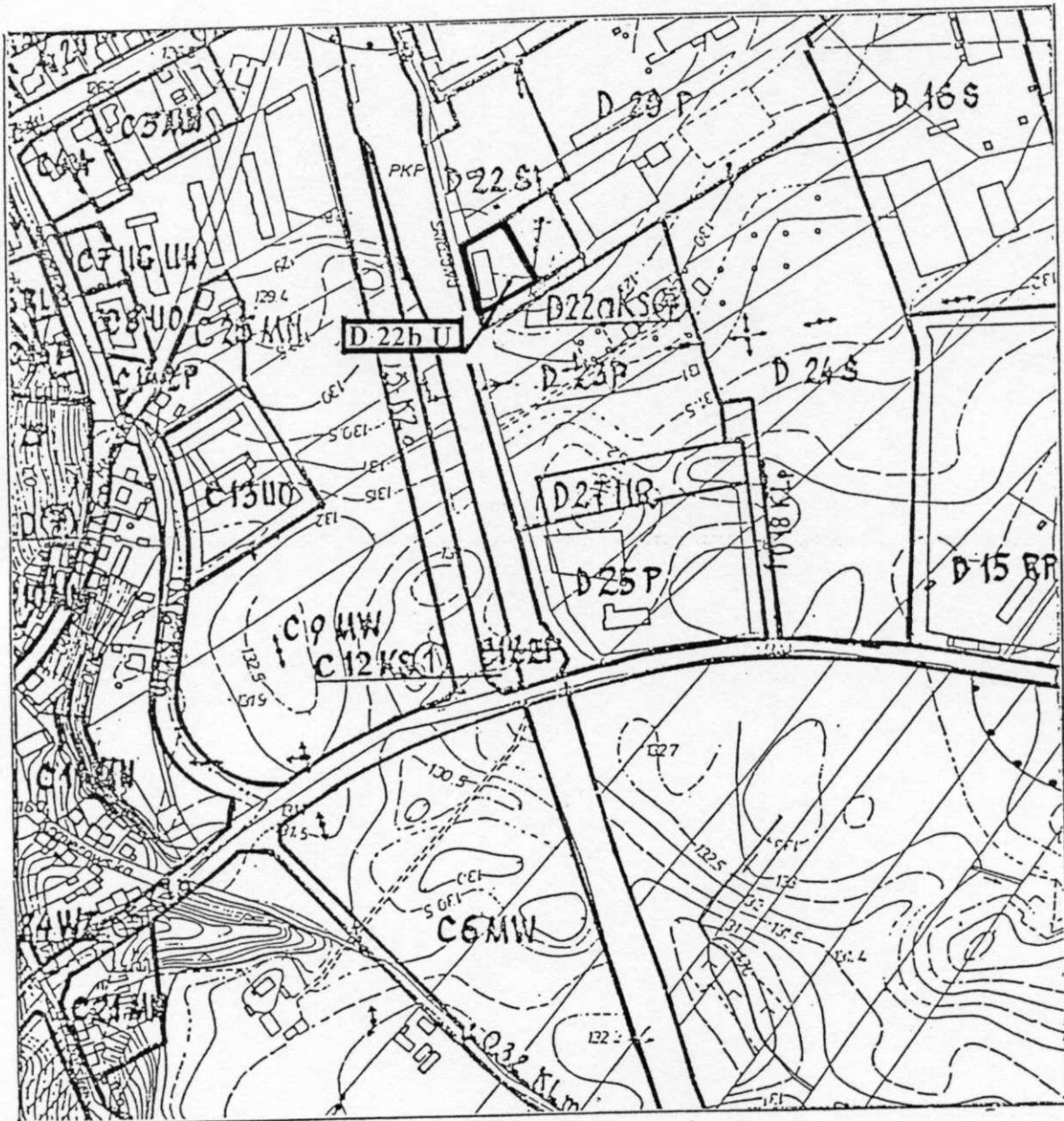
ZMIANA W RYSUNKU PLANU TEREN OBJĘTY ZMIANĄ - SYMBOL D 22b U

ZAŁĄCZNIK NR 1 do uchwały nr XII/131/99 Rady Miejskiej w Sępólnie Kraj. z dnia 31.08.1999