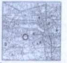
Mapa OBSZAR OBJĘTY PLANEM sytuacyjno-wysokościowa skala 1:1000

WYKRS ZE STUDIUM UWARUNKOWAŃ I KIERUNKÓW ZAGOSPODAROWANIA PRZESTRZENNEGO GMINY SĘPÓLNO KRAJEŃSKIE UCHWAŁONEGO UCHWAŁĄ NR XXXI/RADY MIEJSKIEJ W SĘPÓLNIE KRAJEŃSKIM Z DNIA 21 PAŹDZIERNIKA 1999r. SKALA 1:25 000