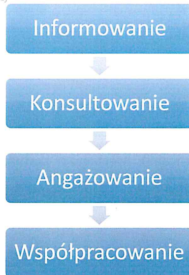
Rysunek 8 Poziomy partycypacji społecznej