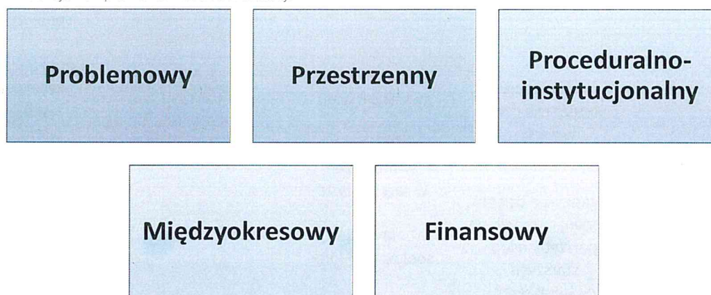
Rysunek 7 Rodzaje komplementarności rewitalizacji

Niezwykle istotnym aspektem wdrażania projektów i przedsięwzięć rewitalizacyjnych jest zapewnienie ich komplementarności w szerokim spektrum funkcjonowania. Komplementarność ma charakter: