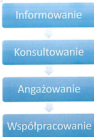
Rysunek 8 Poziomy partycypacji społecznej