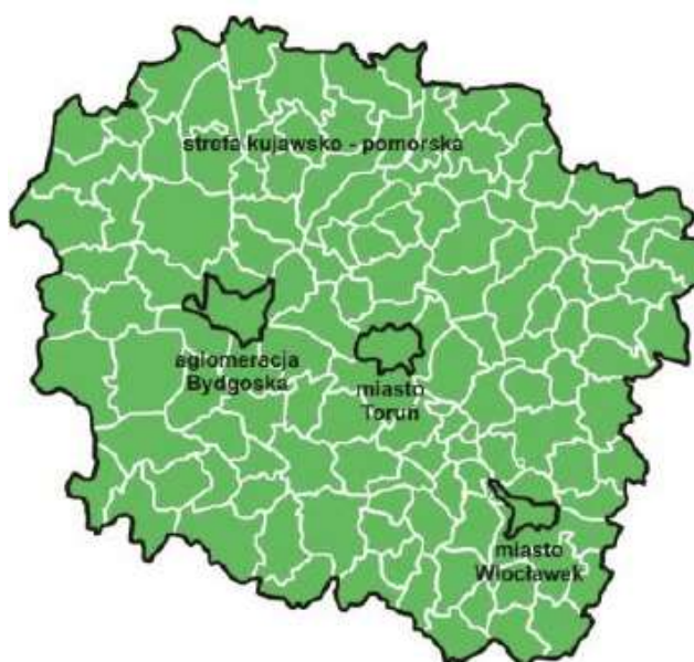
Rys. 4. Podział województwa kujawsko-pomorskiego na strefy

Pod względem spełniania kryteriów odnośnie ochrony roślin uwzględnia się: