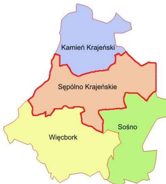
Rys. 1. Położenie Gminy Sępólno Krajeńskie na tle powiatu sępoleńskiego.