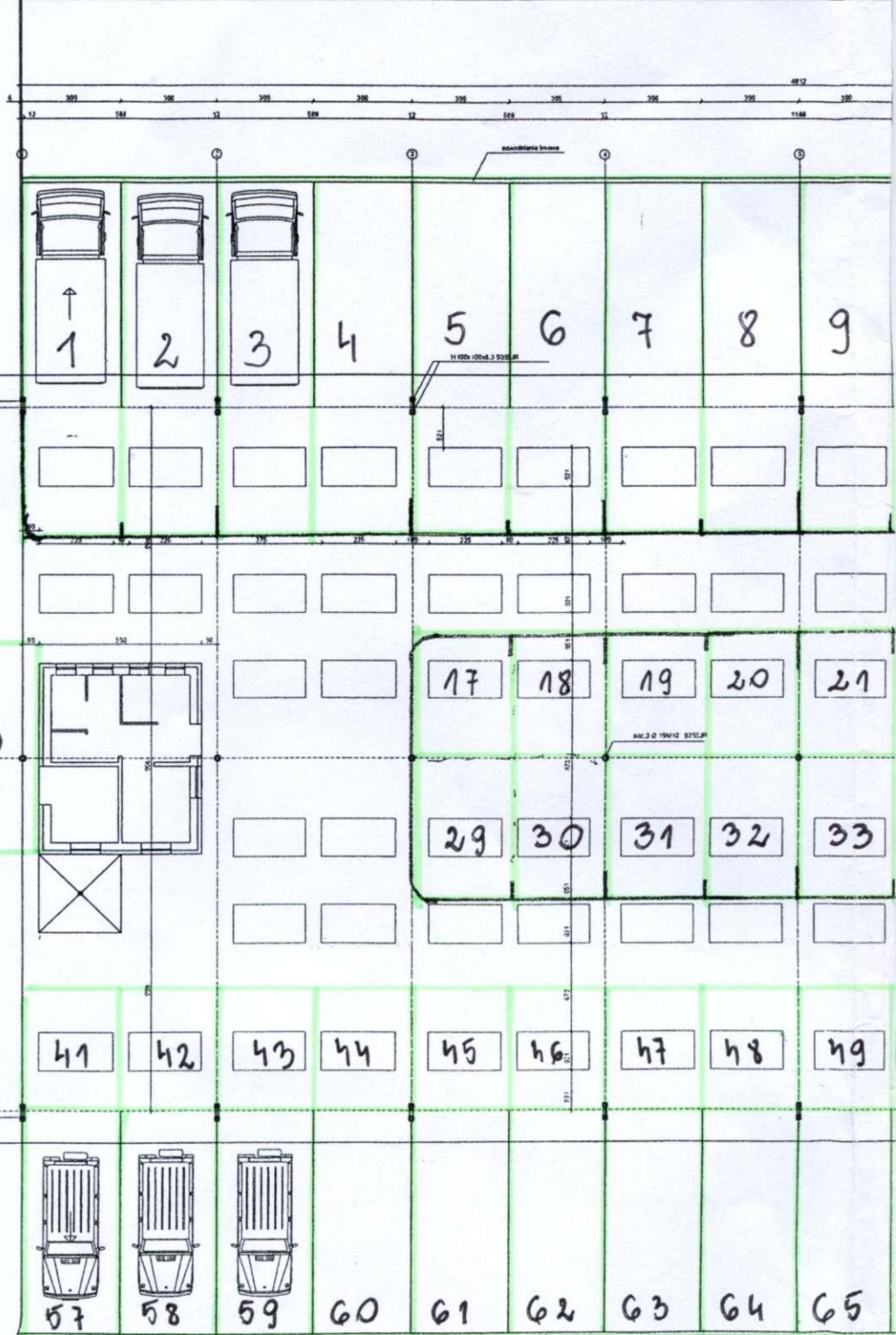
RZUT PARTERU 1:100